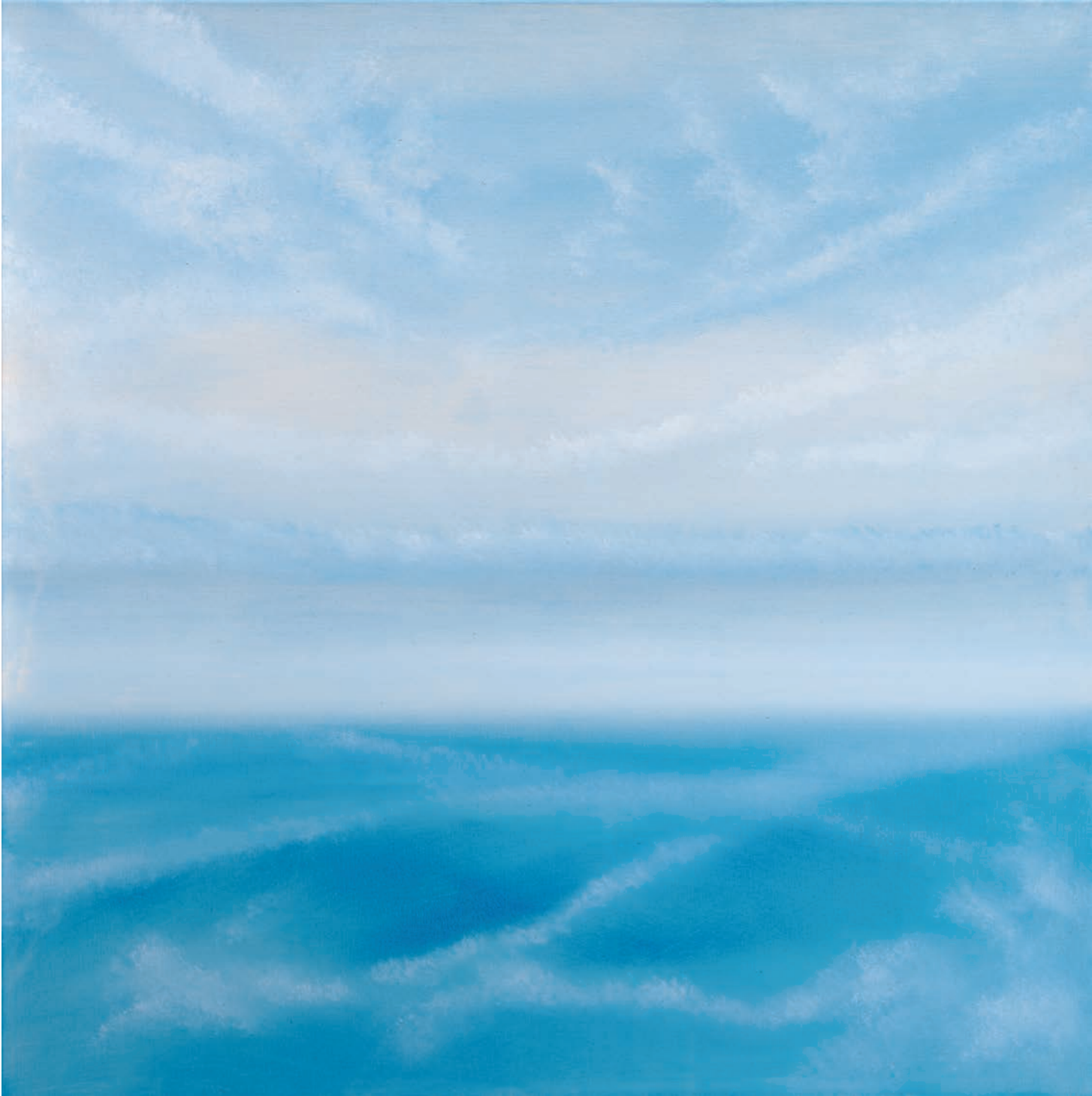
Heaven II, 100 x 100 cm, 2005