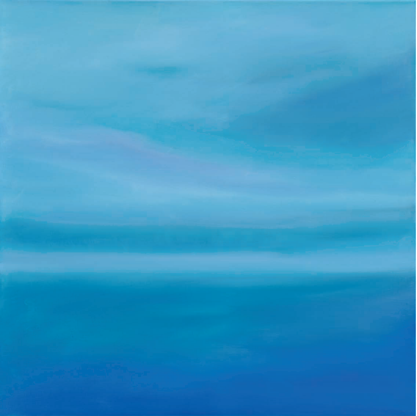
Heaven I, 100 x 100 cm, 2005