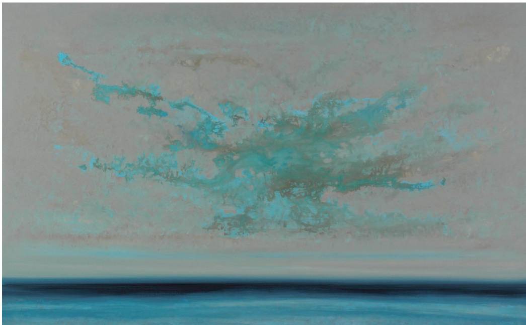
29 Kraftvolle Veränderung, 80 x 130 cm