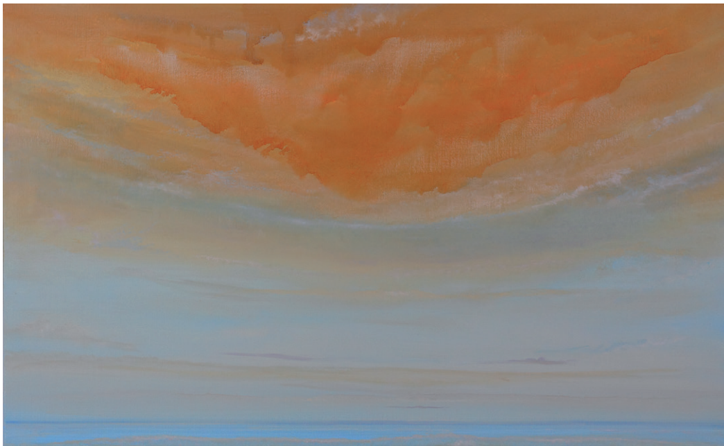
26 A place in heaven, 80 x 130 cm