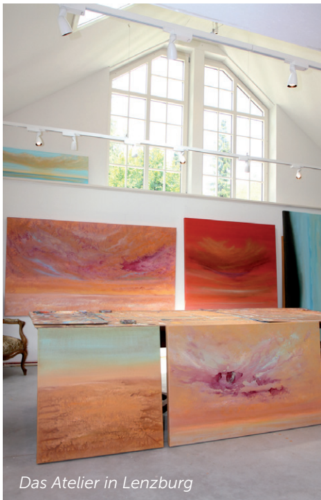
Das Atelier in Lenzburg