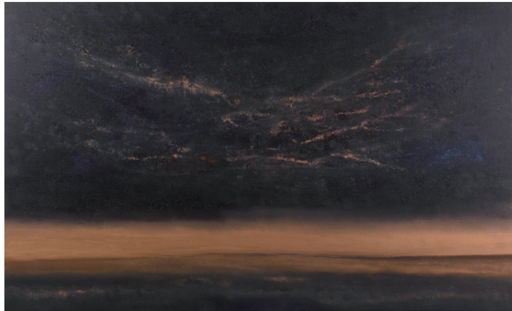
25 Mystic moment, 110 x 180 cm