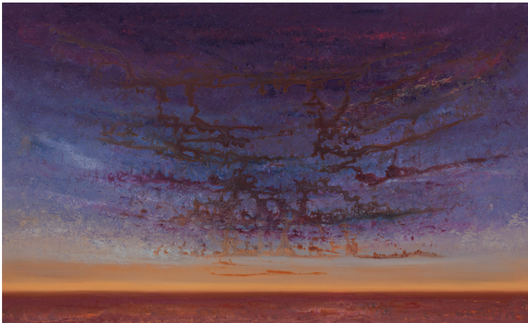
7 A dream of sky, 110 x 180 cm