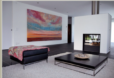
Grossformate & Mittelformate: Gemeinsam plazieren wir «Ihre Himmelswelt» bei Ihnen Zuhause.