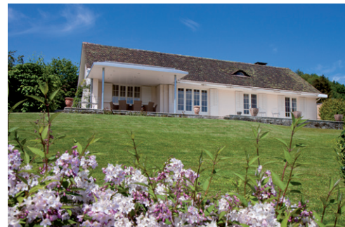
Das Atelier-Haus in Lenzburg

Sie sind herzlich eingeladen jederzeit mit mir Kontakt aufzunehmen, wenn Sie meine Werke verpflichtungsfrei in einem meiner Ateliers erleben möchten.