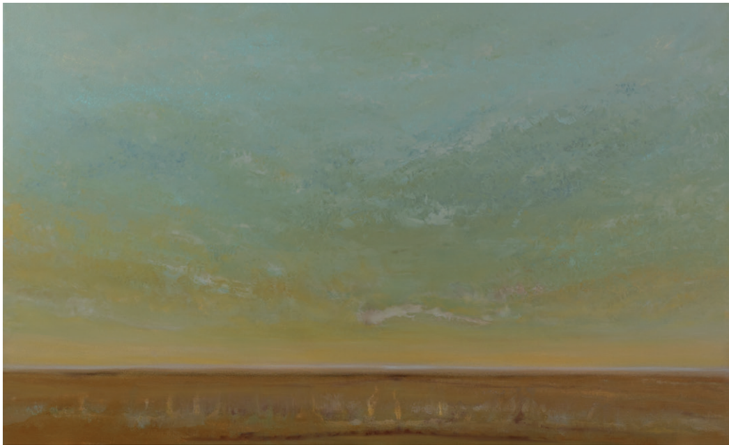
24 Out there, in my dreams, 110 x 180 cm