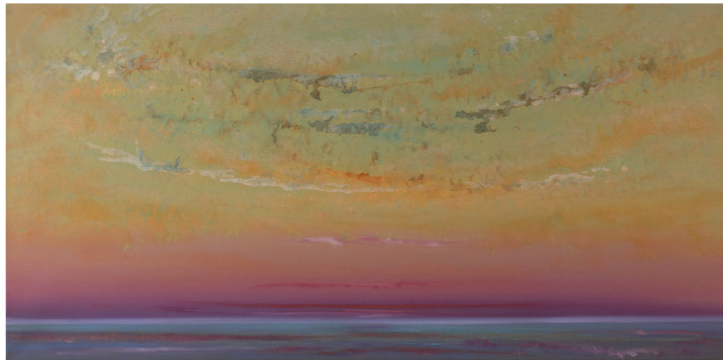
30 Silent place of mine, 50 x 100 cm